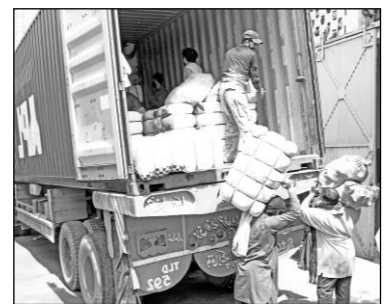
パキスタンに輸出した 古着の荷下ろし カラチ港側の倉庫にて