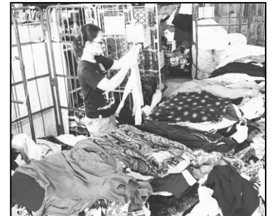
届いた古着の仕分け JFSA 千葉センターにて