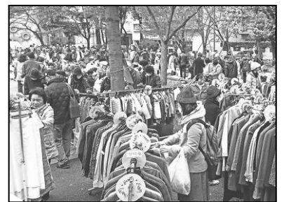
国内販売 フリーマーケットにて